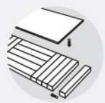
Lámina y base en madera maciza