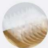
9 capas de barniz